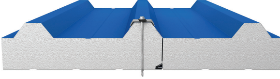
Birleşim Detayı / Connection Detail

Dıştan vidalı çatı panelimiz; 5 hadveli formda, EPS dolgulu olarak üretilmektedir. Yalıtımında EPS tercih edildiği için hafif ve ekonomiktir. EPS (Genleştirilmiş Polistiren) çevre dostu bir yapı elemanı olup, bünyesinde bakteri üretmez. Yüksek yük taşıma kapasitesi sağlayan EPS dolgulu çatı panelimiz yapılarınız için ekonomik bir alternatiftir.