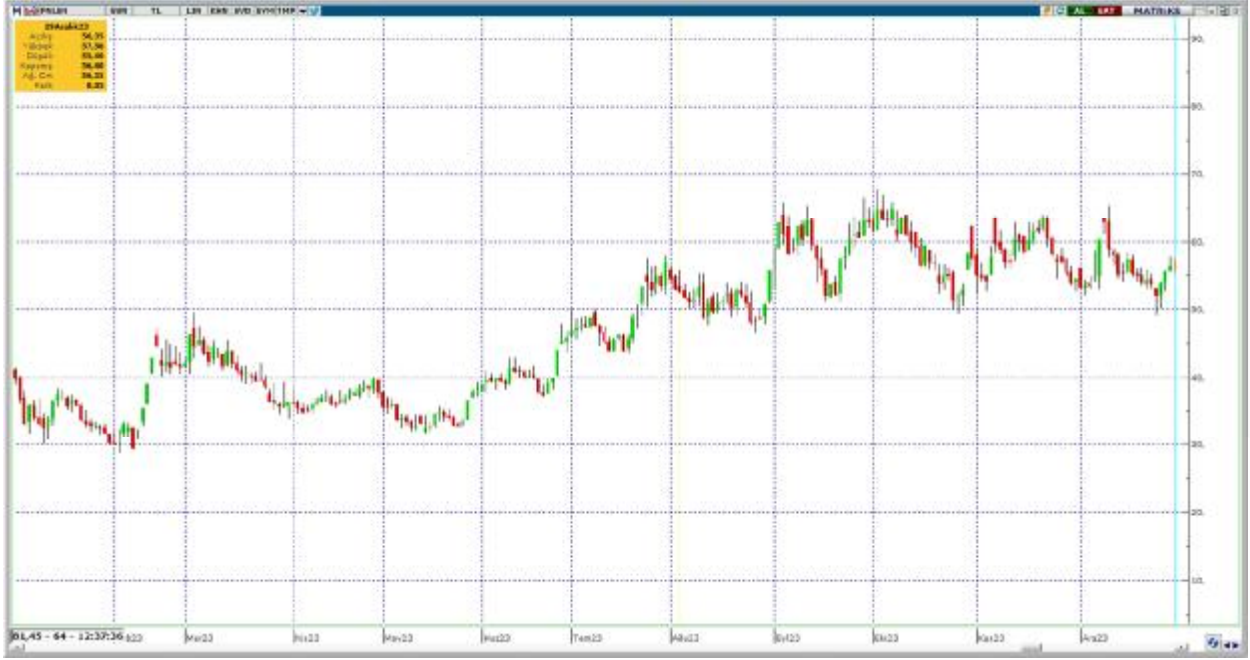
Yıllık grafiğin TL bazlı görünümü