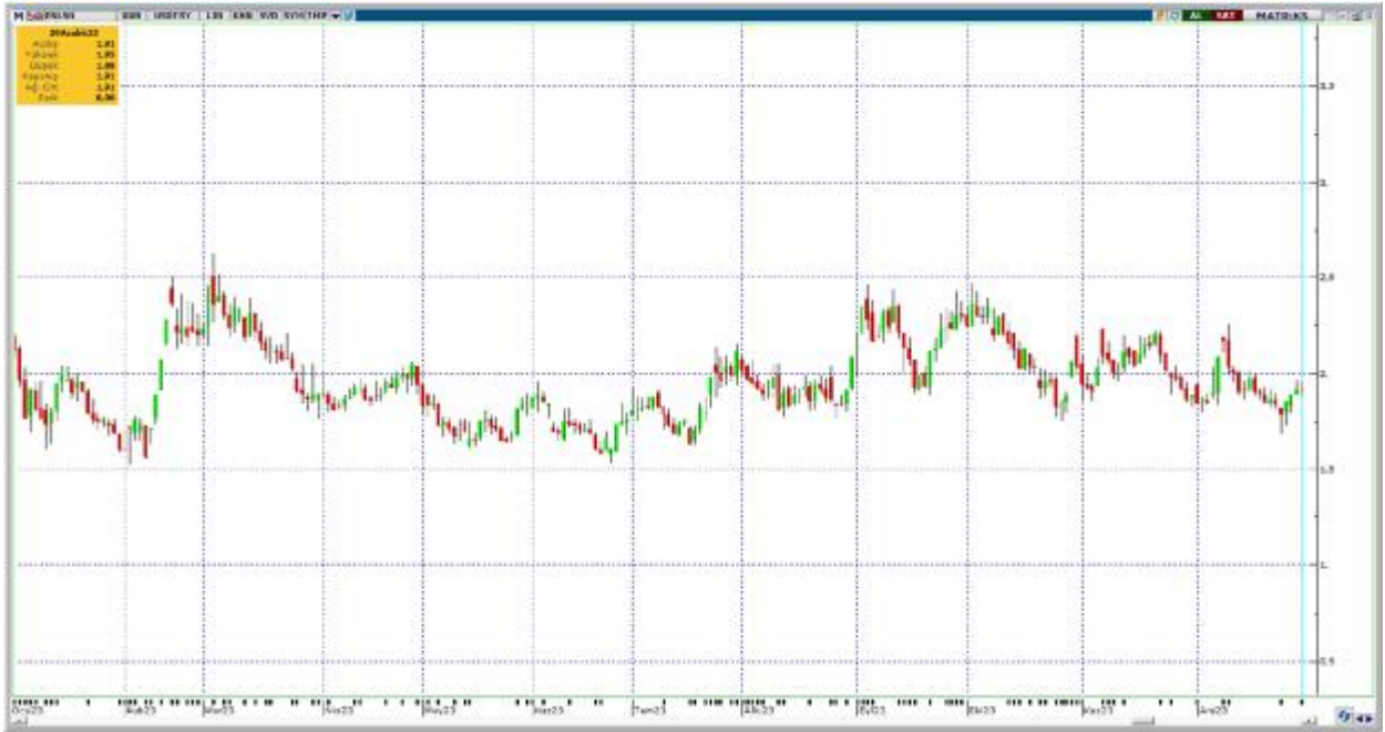
Yıllık grafiğin USD bazlı görünümü