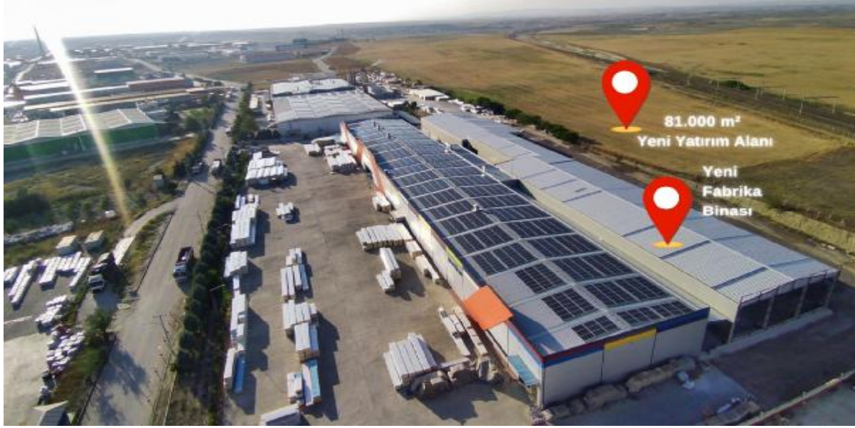
Foto1-Ankara Fabrikası'nın son hali

Temettü Politikası: Şirketimizin 30.03.2023 tarihinde gerçekleştirilen 2022 yılı Olağan Genel Kurul toplantısında, SPK'nın II19.1 sayılı Kâr Payı Tebliği ve II-17.1 sayılı Kurumsal Yönetim Tebliği ile Esas Sözleşmemizin "Kârın Tespiti ve Dağıtım" başlıklı 16'ncı madde hükümleri çerçevesinde hazırlanan "Kâr Dağıtım Politikası" oybirliği ile kabul edilmiştir. Anılan Genel Kurul toplantısında, ayrıca, Şirketimizin bağımsız denetimden geçmiş 2022 yılı finansal tablolarında yer alan 166.710.690,80 TL tutarındaki net dönem kârının dağıtım görüşülmüş ve ortaklarımıza toplam brüt 41.765.283,95 TL ve net 37.588.755,56 TL nakit kâr payı dağıtılmasına ve kâr payının dağıtımına 03.08.2023 tarihinde başlanması kararlaştırılmıştır. Dağıtılan kâr payının sermayeye oranı brüt %55,68705, net %50,11834 olup, halka açık sermaye tutarına tekabül eden kâr payı yatırımcıların hesaplarına aktarılmak üzere Merkezi Kayıt Kuruluşu A.Ş.'ne ödenmek suretiyle kâr dağıtımını tamamlanmıştır.